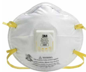
RESPIRADOR 8210V N95

El respirador libre de mantenimiento 3M® 8210 brinda una efectiva, confortable e higiénica protección respiratoria contra partículas sólidas y líquidas sin aceite. Fabricado con un Medio Filtrante Electrostático Avanzado, novedoso sistema de retención de partículas que permite mayor eficiencia del filtro con menor caída de presión.