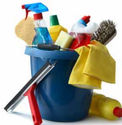
ARTÍCULOS DE LIMPIEZA