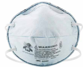
RESPIRADOR 8246 R95

Respirador desechable para partículas N100 está diseñado para ayudar a proporcionar protección respiratoria confiable contra ciertas partículas de base no aceitosa. Características: válvula 3M™ Cool Flow™.