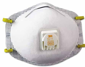
RESPIRADOR 8211 N95

El respirador libre de mantenimiento 8210V N95 cuenta con la característica exclusiva y patentada; la válvula 3M Cool Flow® que ayuda a proveer al trabajador una protección respiratoria cómoda y confiable contra ciertas partículas sin aceite. Es ideal para entornos de trabajo húmedos, calurosos con polvo y que requieran largos periodos de uso.