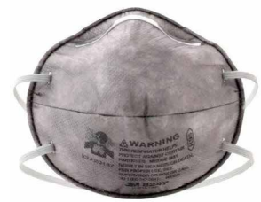
RESPIRADOR 8247 R95

Respirador desechable para partículas N95 cuenta con un sello de contacto de goma espuma y la Válvula 3M™ Cool Flow™ para ayudar a brindar una protección respiratoria confiable y cómoda para el trabajador. Resulta ideal para entornos de trabajo calurosos o con polvo que requieren períodos de uso prolongados.