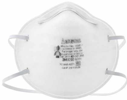
RESPIRADOR 8200 N95

El respirador ligero, desechable N95 partículas está diseñado para ayudar a proporcionar la calidad, la protección respiratoria trabajador confiable. 3M utiliza una variedad de tecnologías y características innovadoras para ayudarle a cumplir su protección respiratoria y necesidades de confort. El medio de filtración patentada de 3M está diseñado para facilitar la respirar.