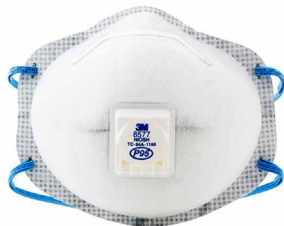
RESPIRADOR 8577 P95

El respirador para partículas libre de mantenimiento 3M 8247 R95 ayuda a proporcionar protección respiratoria confiable contra ciertas partículas de aceite y sin aceite. Construido con una capa de filtro de carbono para el alivio de niveles molestos de vapores orgánicos