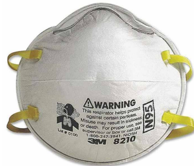
RESPIRADOR 8210 N95

El respirador ligero, desechable N95 partículas está diseñado para ayudar a proporcionar la calidad, la protección respiratoria trabajador confiable. 3M utiliza una variedad de tecnologías y características innovadoras para ayudarle a cumplir su protección respiratoria y necesidades de confort. El medio de filtración patentada de 3M está diseñado para facilitar la respirar.