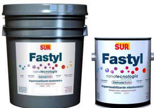
PINTURAS Y SOLVENTES