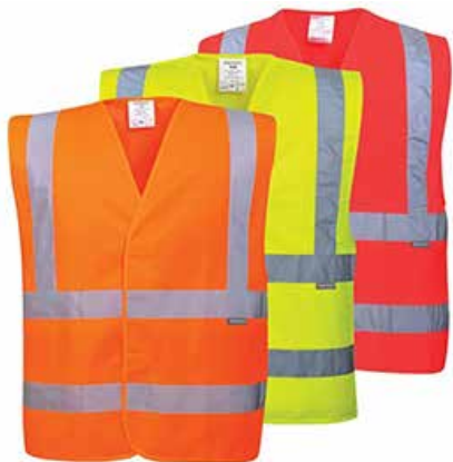
EQUIPO DE PROTECCIÓN PERSONAL

TENEMOS UNA EXTENSA GAMA DE PRODUCTOS PARA SATISFACER TUS NECESIDADES