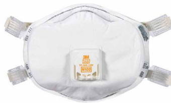
RESPIRADOR 8233 N100

Respirador desechable contra partículas con o sin presencia de aceite, en ambientes con polvos, con válvula de exhalación Cool Flow™ 3M®. Es ideal para ambientes molestos de vapores orgánicos. Aplicaciones: Fundición, laboratorios, minería.